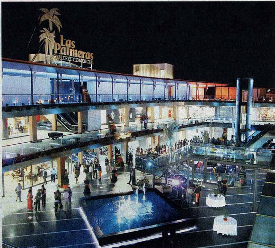
Distintos aspectos del centro comercial en la noche de su inauguración el pasado día 10 de septiembre.